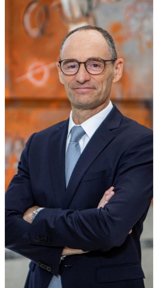
조안 아미고 Applus+ CEO

여러분의 도움으로 Applus+는 앞으로도 이유 있는 자신감을 가질 수 있을 것입니다.