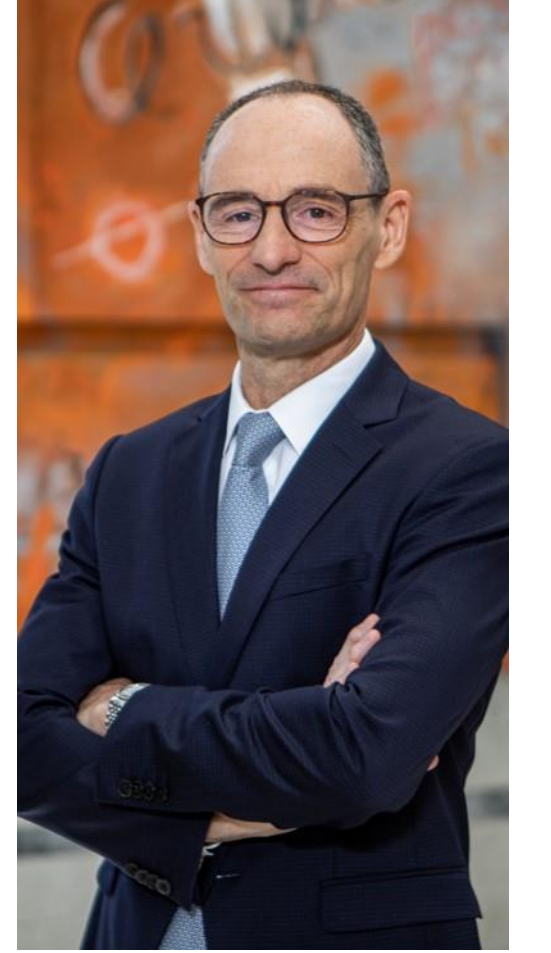
जोन अमीगो Applus+ सीईओ

आपकी मदद से, Applus+ उस विश्वास को हासिल करना जारी रखेगा जो हम सभी को इस पर है।